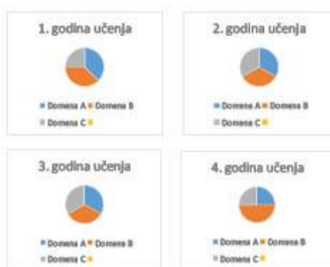
1. slika: Model strukture predmeta TK i odnos domena u četiri godine učenja i poučavanja.

U nastavnome predmetu Tehnička kultura učenici usvajaju i primjenjuju znanja, razvijaju vještine, stavove, odgovornost i samostalnost vezane uz opću tehničku kulturu, a time i opću kulturu. Upoznaju različita područja tehnike poput prometa, graditeljstva, strojarstva, elektrotehnike i drugih koja su svojim dostignućima utjecala na nebrojene promjene uvjeta i kvalitete života čovjeka kao pojedinca, na promjene u društvu i u širemu prirodnomu okružju. Stjecanje opće tehničke kulture, tj. tehničke pismenosti, ostvaruje se usvajanjem određenih znanja o tehničkim tvorevinama, koje nas okružjuju, dobrobiti, koju donose, načinu rada i mogućim opasnostima. Razvijanje vještina omogućuje kreativnost i inovativnost u dizajniranju i izradi tehničkih tvorevina te sigurno korištenje i pravilno održavanje tehničkih tvorevina kao i kritički odnos koji uključuje razmatranje širega konteksta tehnike i njezina utjecaja s ekološkoga, ekonomskoga, kulturološkoga i sociološkoga aspekta. Cjelovitim sagledavanjem tehnike u osnovnoškolskome obrazovanju postiže se njezina relevantnost za sve učenike neovisno o specifičnim interesima i odabiru budućega zanimanja. Štoviše, omogućuje se razvoj učenika u odgovornoga mladoga građanina koji će u budućnosti moći kritički sagledavati svoj uži i širi tehnički okoliš i biti spremniji za donošenje kvalitetnih odluka.