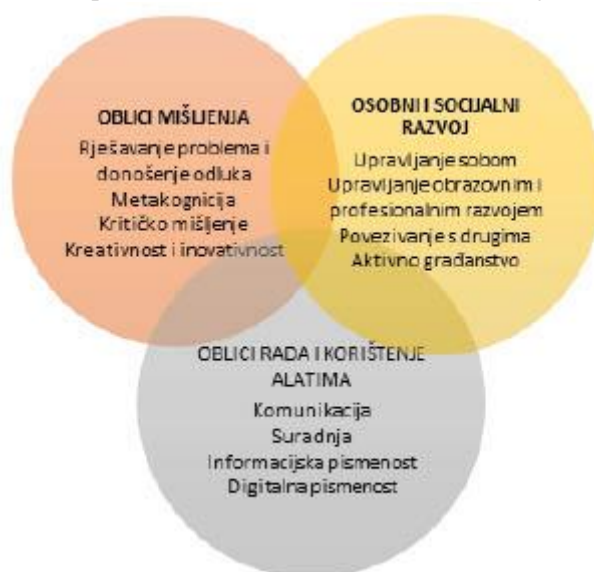
3. slika: Grafički prikaz temeljnih kompetencija